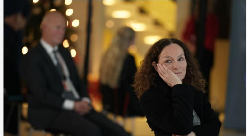
ÅPNET TILSYN: Ansatte i Folkehelseinstituttet med Camilla Stoltenberg i spissen har jobbet betydelig mer overtid siden pandemien utbrudd. Nå er Arbeidstilsynet på saken.